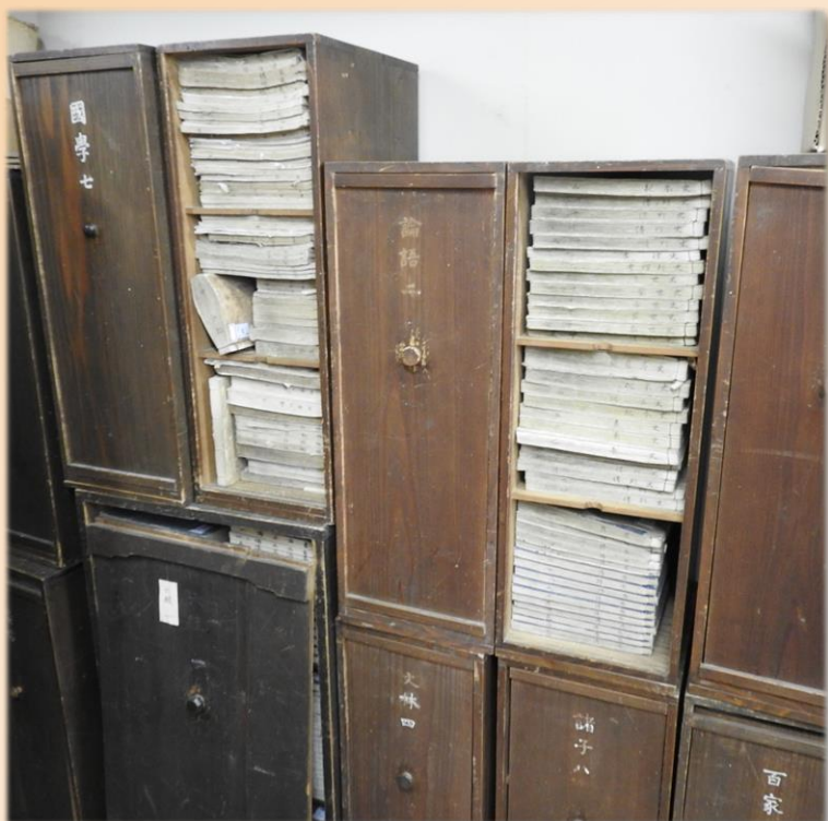
二口佐藤東蔵家資料