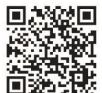
QRコードをひっ! 図書館HPにアクセス

・20~30分くらいです 感染状況によりお休みする期間も あります。ホームページでご確認 下さい