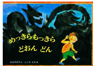
「めっきらもつきら どおん どおん」 長谷川摂子 文 ふりやなな 絵 福音館書店 1990年刊