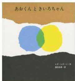
藤田圭雄訳 至光社 1967