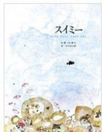
谷川俊太郎訳 好学社 1969