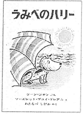
『うみへのハリー』 どろんこで家族を驚かせたハリー 次は、海で一騒動。