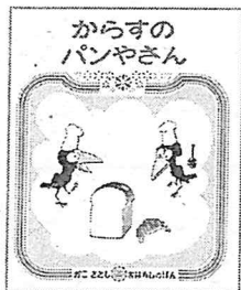
『からすのパンやさん』 かこさとし 偕成社