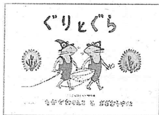
『ぐりとぐら』 中川李枝子 福音館書店