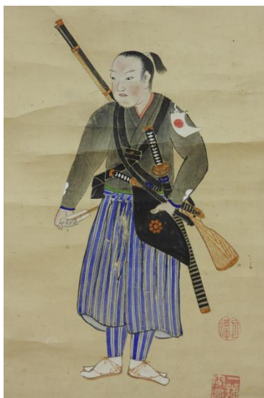
市原円潭筆「戊辰戦争における 庄内藩兵の軍装」